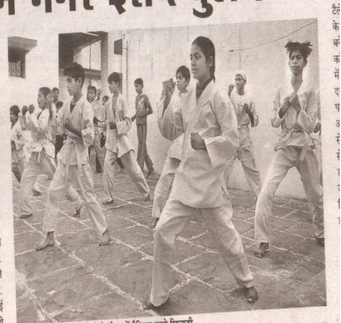
महानगर में चल रहे कराटे-दो के कैम्प में प्रैक्टिस करते खिलाड़ी

उन्होंने बताया कि जापान की इस मार्शल आर्ट को सीखने के लिए राजधानी में भी खिलाड़ियों की संख्या तेजी से बढ़ रही है. संसाधनों का अभाव है मगर धीरे-धीरे इन्हें सुधारने की कोशिश की जा रही है. इस खेल में गर्ल्स प्लेयर की संख्या फिलहाल तेजी से बढ़ रही है. इसका सबसे बड़ा कारण है कि वे खुद को फिजिकली फिट रखना चाहती हैं. बहुत